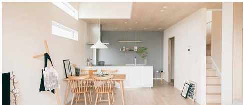
木目天井が美しいスκανジナビアンスタイルの家